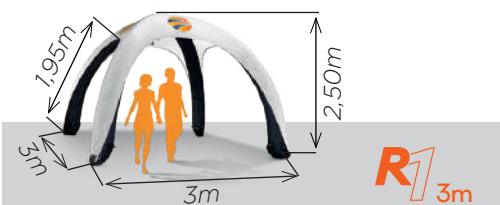
Disponible en 3 dimensions

Pied gonflable en Dacron® 280g/m². Après gonflage, l'air est maintenu dans la structure.