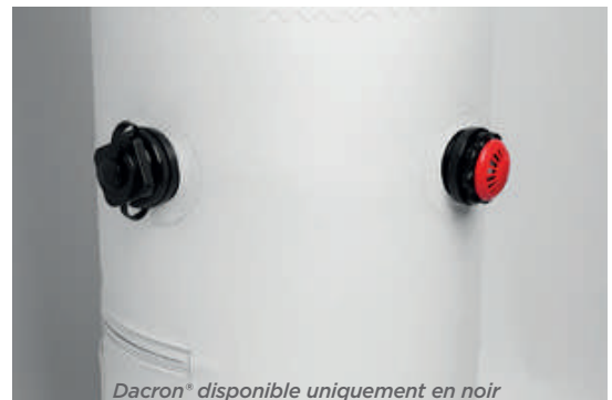
Dacron® disponible uniquement en noir

Pied gonflable en Dacron® 280g/m². Après gonflage, l'air est maintenu dans la structure.